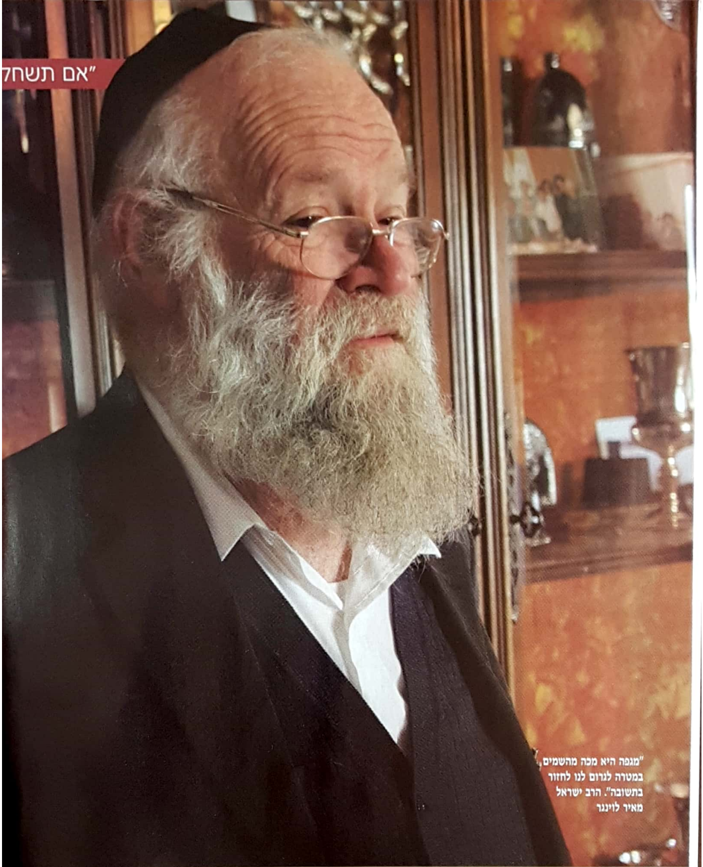
"מגפה היא מכה מהשמים במטרה לגרום לנו לחזור בתשובה". הרב ישראל מאיר לוינגר

לוינגר בעשרות כתיבי עת מדעיים תורניים, כגון כתב העת התורני-כשרותי 'תהודת כשרות' ועוד. הוא הוציא לאור ספרים רבים ופרסם מאות מאמרים הנוגעים להלכות טריפות ודיני השחיטה מבחינה מדעית. הספרים ההלכתיים שהוציא לאור הם היחידים שלצד הסכמותיהם של גדולי הדור כמו מרן הגר"ש אלישיב, מתנוססים עליהם גם, להבדיל, הסכמותיהם של מדענים דגולים בתחום מדעי החי.