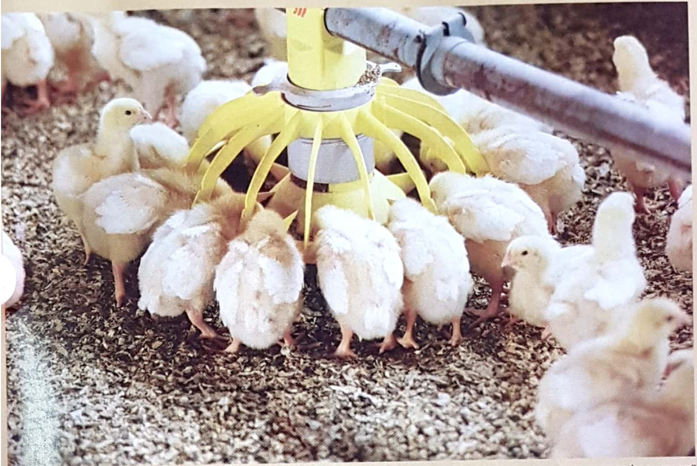
"כששמעתי על התפרצות שפעת העופות התפללתי שהיא לא תגיע לישראל". אפרוחים לפני השמדה